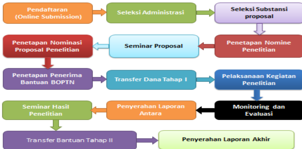
Gambar 3.2: Alur Pengelolaan Penelitian / Flow Chart Penelitian

Disesuaikan dengan kondisi negara yang sedang mengalami pelonjakan pandemic Covid-19 yang belum juga tuntas, maka untuk penelitian on-going pencairan dana penelitian dilakukan dalam 1 (satu) tahap kepada peneliti, namun dana tetap dilakukan pemblokiran di rekening peneliti sampai penelitian dilakukan review akhir oleh reviewer. Selanjutnya untuk penelitian tahun 2021, tetap mengacu kepada gambar 3.2.