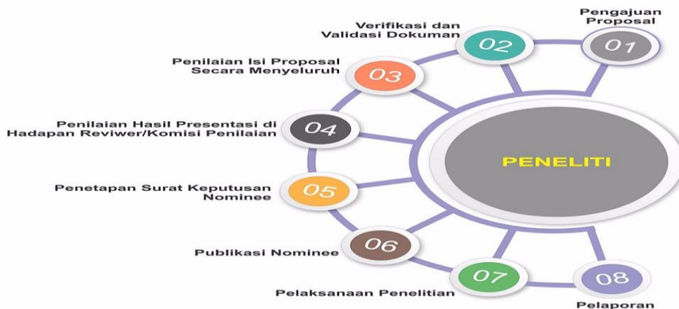
Gambar 3.1. Alur Penelitian Litapdimas

Penelitian di lingkungan Ditjen Pendis Kementerian Agama RI terintegrasi dalam sistem Litapdimas. Litapdimas sendiri merupakan sistem pangkalan data penelitian dan pengabdian kepada masyarakat yang dikembangkan oleh Subdit Penelitian Pengabdian kepada Masyarakat Dit. PTKI Kemenag RI. Penelitian pada sistem Litapdimas memiliki alur sebagaimana pada Gambar di bawah ini.